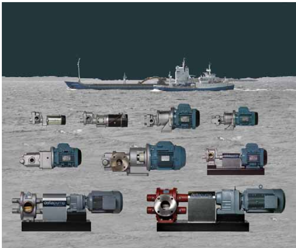
Skipsfart og fiskerier er viktige kundegrupper for Deltapump. Her er et utvalg av pumpene de produserer.

Våre pumper inngår gjerne som en del av andres produkter. Et eksempel på det er kompressorene til Sperre Industrier AS på Ellingsøy. For oss har det alltid vært viktig å kunne snu oss raskt, og ha kort leveringstid. Våre kunder spenner fra store internasjonale konserner til mellomstore og små bedrifter, og enkelte private.