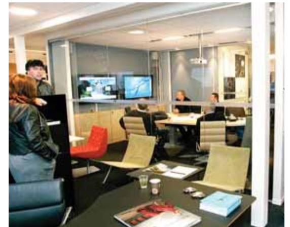
Interiørforum har utstilt et teknisk avansert møterom i det nye lokalet hvor de presenterer moderne AV utstyr.

- Vårt tidligere lokale over Obs Bygg har fungert brukbart, men vi følte ikke at produktene vi selger kom helt til sin rett, samtidig som vi hadde lite lagerplass.