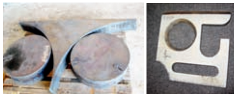
Stålsenteret kan levere avanserte skjæreoperasjoner i stål av ulik størrelse og tykkelse.